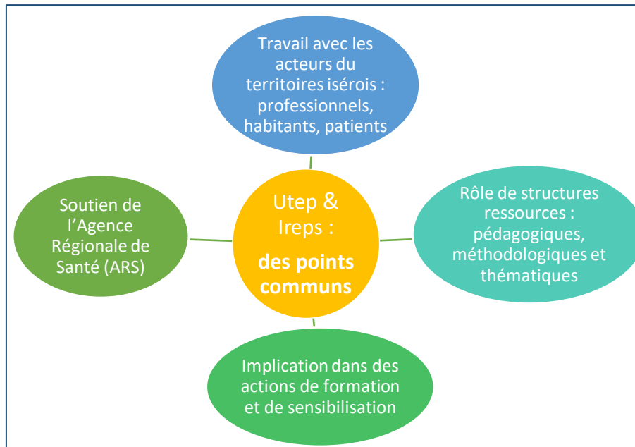
Figure 1. Deux structures différentes avec des points communs