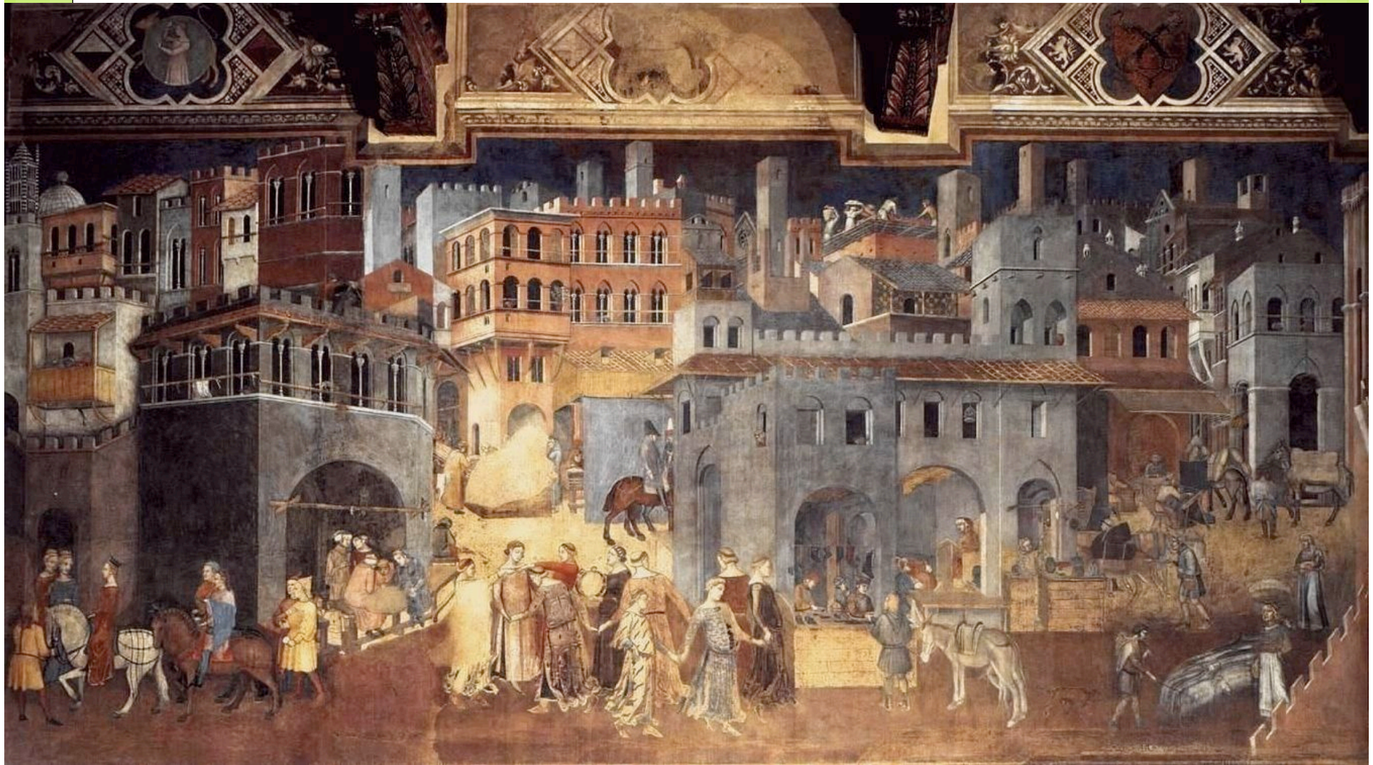
Ambrogio Lorenzetti, Allégorie du bon gouvernement, Sienne, XIVème s.