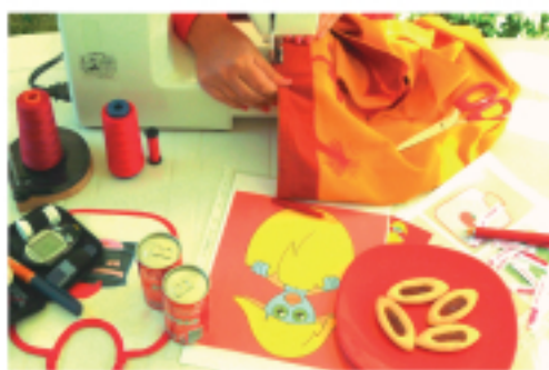
Le diabète, une vie en rouge

Pourquoi faire toujours avec du sucre sur son visage, nous autres diabétiques avons l'habitude de nous lancer dans des collections de sucres emballés!