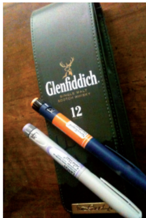
Histoire de plaisirs

Une grande dose d'humour, voilà ce je propose la force contre la maladie.