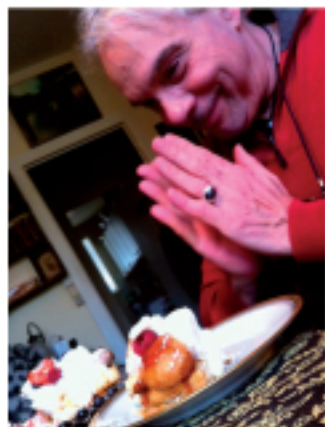
Prière à Saint Honoré

À 2 longueurs de l'hypo, le cas de La Moutte, Agathe d'Orsay, Cécile Pichon et de tous ces autres diabétiques qui a fait passer une hypo au sommet.