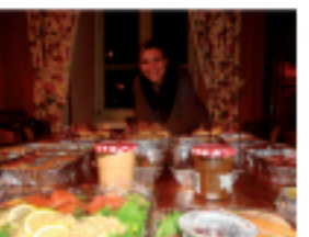
Comment préparer son mariage sans excès

Visite de contrôle des pieds du diabétique.