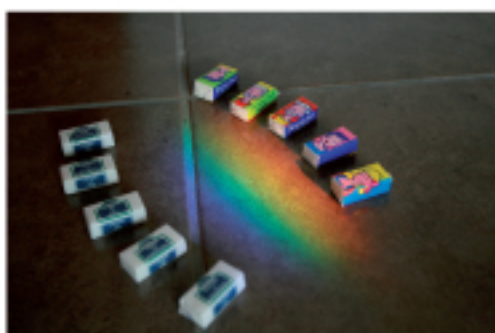
Collections de sucres

Cette photo illustre le combat quotidien entre l'insuline et le glucose et l'équilibre de chaque instant qu'il faut trouver à côté de notre vie.