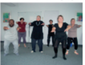
Education Thérapeutique à Nantes

À mon âge et avec mon beau frère diabète (DM2) plus de 30 ans de diabète, comment faire les fêtes, d'après et plaisir à tous.