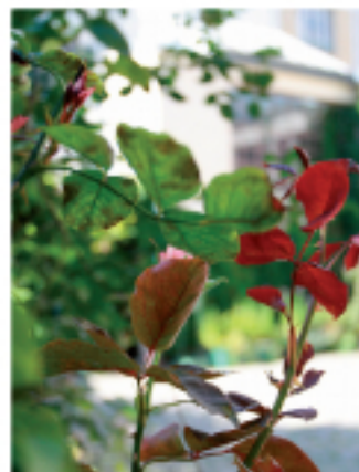
Attention, ça pique...

Les plantes ont besoin d'eau pour s'épanouir et rester en vie, moi j'ai besoin de mon insuline. Sans elle je me ferais si je ne suis ni trop malade et passant je m'écroule. Lorsque je suis bien, j'équilibre, je respire.