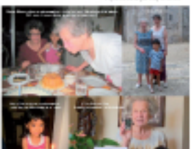
Fêtes et Plaisirs

Après une session d'éducation thérapeutique en groupe, l'activité physique permet de se reconnecter de son corps et de donner du sens à sa qualité personnelle.