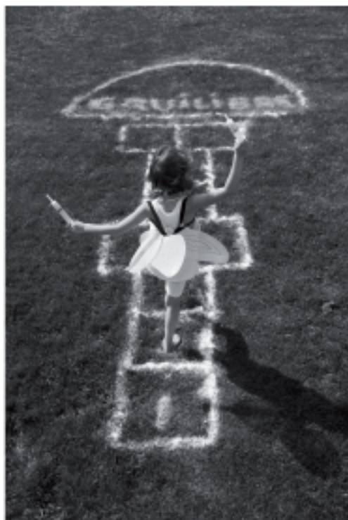
La vie, un jeu d'équilibre