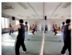
Bouger en folie : boug'OSE attitude