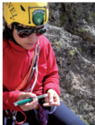
À 2 longueurs de l'hypo

Une attitude photographique plénière le combat contre la maladie, un esprit sain dans un corps sain.