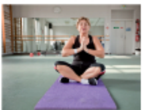
Zen et Zolie : la zen'OSE attitude

Moi et mon beau frère... On a voulu remettre nos 7 ans de personnes dynamiques dans le sport. C'est un groupe de personnes diabétiques participent à une session d'éducation thérapeutique.