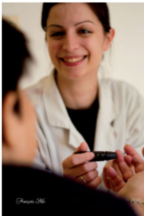
Un sourire ne coûte rien, mais donne un peu d'espoir au patient

d'après les résultats d'un concours photo destiné aux patients et aux soignants