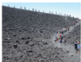
Marche sur l'Etna